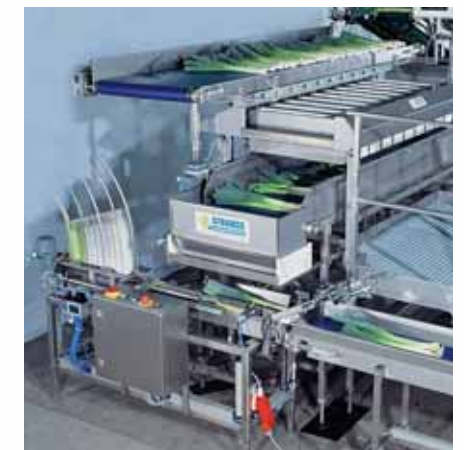
Los hollejos de cartón son alimentados, levantados y entonces llenados automáticamente con los paquetes de puerros por la apertura del almacén.