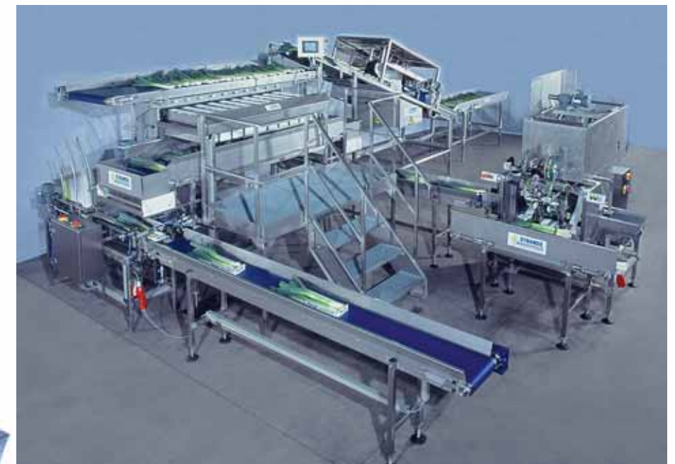
Poco voluminosa y efectiva, la pesadora STRAUSS semiautomática para puerros.