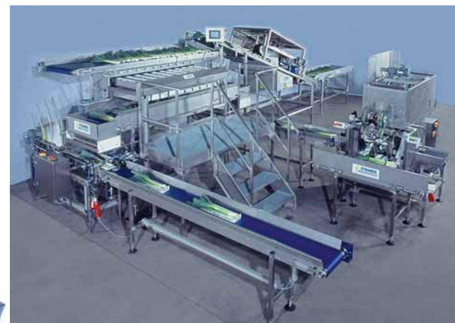
Peu encombrante et effective, la peseuse semi-automatique STRAUSS pour des poireaux.