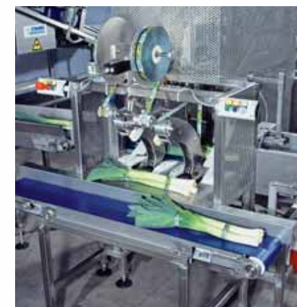
Het nieuw ontworpen banderolapparaat bundelt met behulp van twee kleefbanden de afgewogen porties prei.