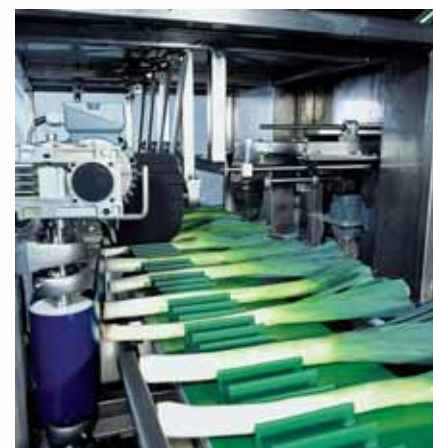
De prei wordt gericht en vervolgens door een speciale voorziening in positie gehouden. Twee messen snijden daarna de prei aan de blad- en aan de wortelzijde.

Heeft u in uw verpakruimte slechts weinig ruimte beschikbaar? Door de compacte bouwwijze van deze machine is het vrijwel altijd mogelijk deze installatie in een kleine ruimte te plaatsen en de beschikbare oppervlakte effectief te benutten.