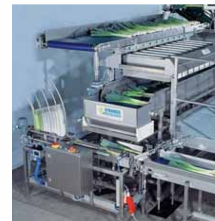
De kartonnen schalen worden volautomatisch aangevoerd, opgezet en aansluitend door het openen van het reservoir met de afgewogen porties prei gevuld.