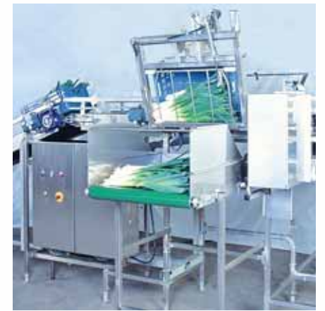
De preikistenlediger als volautomatisch en productvriendelijk ledig apparaat.