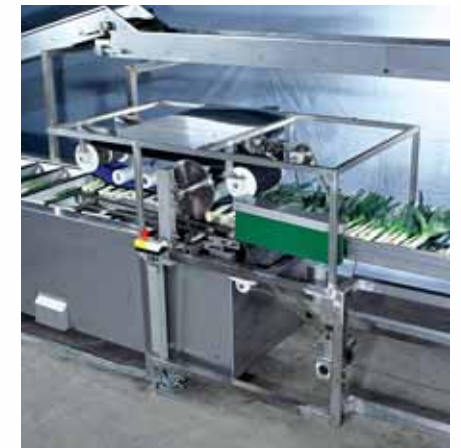
De prei wordt gericht en vervolgens door een speciale voorziening in positie gehouden. Twee messen snijden daarna de prei aan de blad- en aan de wortelzijde.