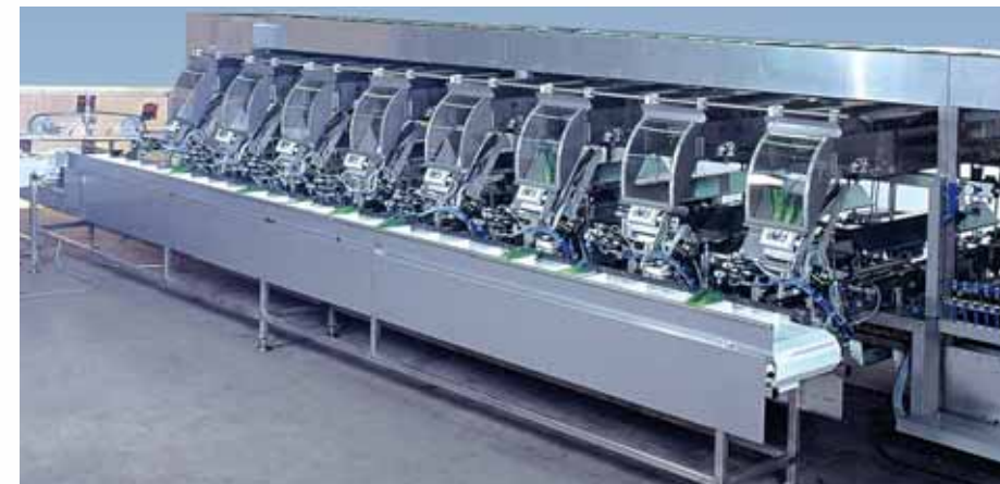
De afgewogen eenheden prei worden door de dwarsbanden naar de inlegrobots getransporteerd. Uit het voorraadmagazijn worden de kartonnen vouwschalen aangevoerd, waarin de prei door het automatisch openen van de klep wordt neergelegd.