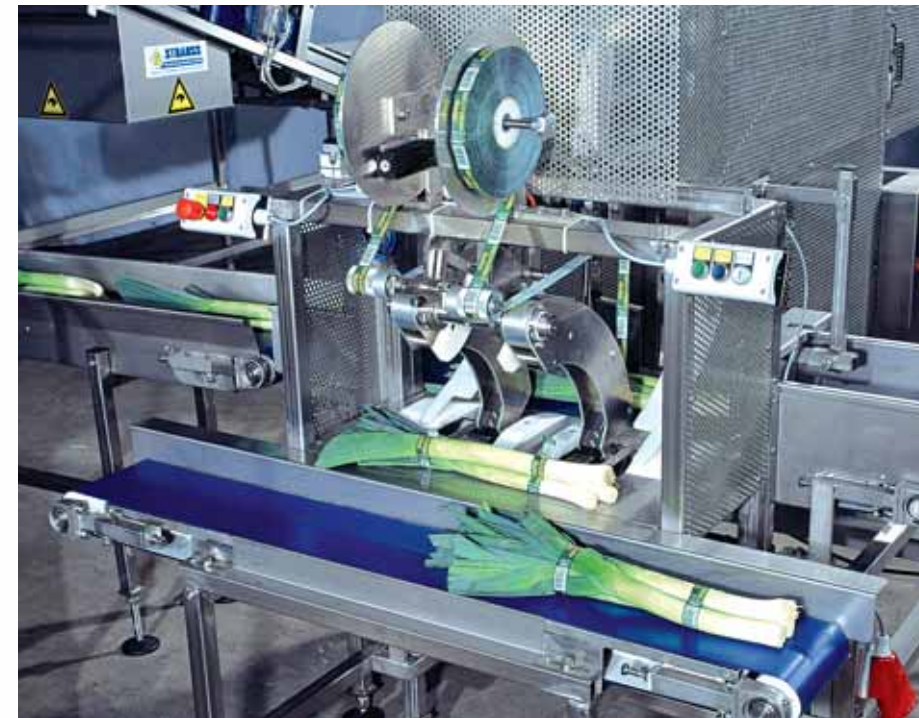
Het nieuw ontworpen banderolapparaat bundelt met behulp van twee kleefbanden de afgewogen porties prei.

Door geavanceerde computertechnologie bent u als gebruiker in staat om eenvoudig de dagelijkse gegevens op te vragen. Het weegstelsel garandeert een zeer grote nauwkeurigheid bij hoge capaciteit.